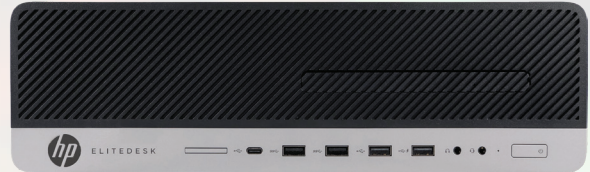
EliteDesk 800 G4 con 16 GB de memoria RAM + 16 GB de memoria Intel Optane