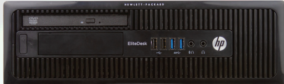
EliteDesk 800 G1 con 32 GB de memoria RAM

Un nuevo equipo de escritorio con memoria Intel Optane superó a un equipo de escritorio de primera generación Realizamos tareas utilizando dos equipos de escritorio HP EliteDesk 800 Series: 2