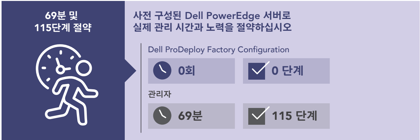
그림 1: 사내 관리 시간(분) 및 단일 PowerEdge 서버 구성 단계. 낮을 수록 좋음.

그림 1에서는 PowerEdge 서버를 재설정된 후 구성 작업을 완료하는 데 걸리는 총 시간과 단계를 보여줍니다. 작업의 전체 목록을 보려면 이 보고서의 과학적 연구 내용 을 참조하십시오. 현장에서 서버를 구성할 때 구축 도구를 사용하면 절약 시간이 달라질 수 있습니다.