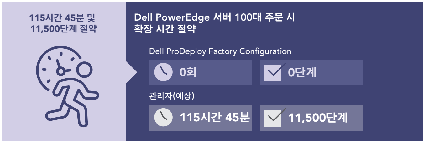
그림 2: PowerEdge 서버 100대 구성을 위해 추정된 사내 관리 시간(시간 및 분) 및 단계. 낮을 수록 좋음.

엔터프라이즈급 조직에서는 종종 서버를 대량으로 교체하고 때로는 일관되게 구성된 많은 서버를 여러 위치에 제공해야 합니다. 첫 번째 테스트 시나리오는 이러한 사용 사례를 반영하고 ProDeploy Factory Configuration 사용의 더 큰 가치를 보여줍니다. 조직이 대규모 서버 설치에서 ProDeploy Factory Configuration을 사용하여 얼마나 많은 시간을 절약할 수 있는지 보여주기 위해 단일 PowerEdge R750 서버 구성에서 서버 100대로 캡처한 시간을 추정했습니다. 그림 2에서 볼 수 있듯이 (관리자가 수동으로 작업을 완료하는 대신) 서비스가 서버 100대에 대한 모든 구성 작업을 완료하도록 허용하면 약 115시간을 절약할 수 있으며 설치 전반에 걸쳐 각 서버에 관해 구성이 일관되게 유지되도록 할 수 있습니다.