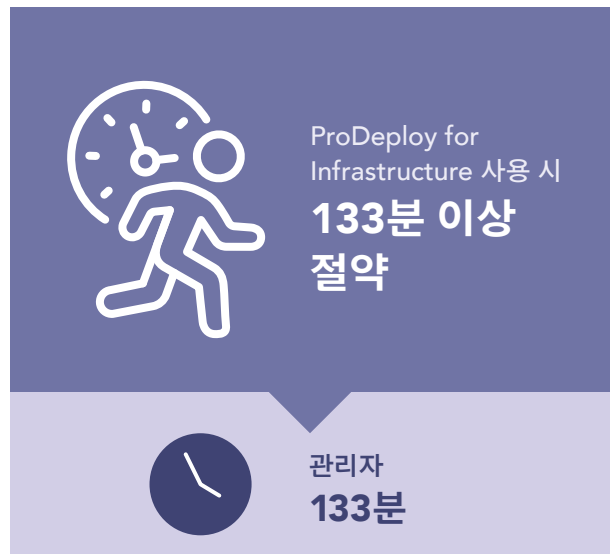
그림 3: 시간(분) 및 단일 PowerEdge 서버 구축 단계. 낮을수록 좋음.

원격 또는 지역 데이터 센터가 있는 조직에는 필요할 때 사이트에 솔루션을 구축할 IT 직원이 없을 수 있습니다. 이러한 종류의 상황을 해결하기 위해 ProDeploy for Infrastructure는 Dell 인증 기술자를 파견하여 광범위한 Dell 솔루션 전문 지식을 활용하고 현장에서 하드웨어를 구축하여 관리 시간(또는 경우에 따라 IT 직원 이외의 시간)을 절약할 수 있습니다. 그림 3에서 볼 수 있듯이 관리자는 단일 Dell PowerEdge R750을 구축하는데 2시간 13분 이상이 필요했습니다. 이는 조직에서 ProDeploy for Infrastructure를 사용하여 절약할 수 있는 관리 시간입니다. 설치 요구 사항은 다양하지만 ProDeploy for Infrastructure를 사용하면 프로젝트 계획, 구축 현장으로의 이동 및 기타 시간 기반 장애물을 제거하여 추가 비용을 절감할 수 있습니다.